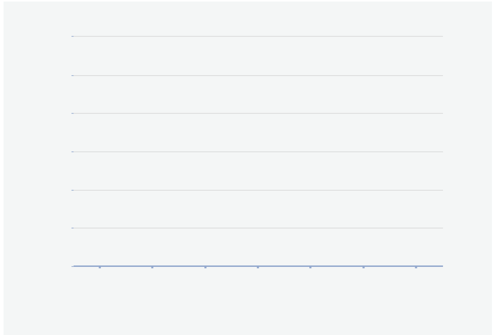
Contracttype personeel (fte) naar regio en geslacht op peildatum 31 december 2016